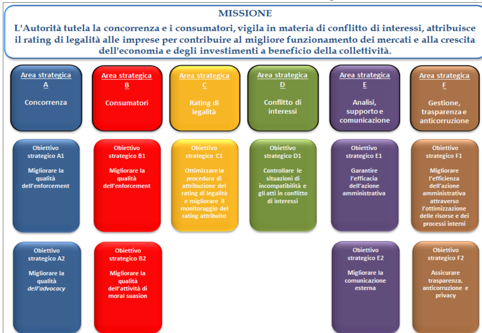
FIGURA 2 - Missione, Aree e Obiettivi Strategici